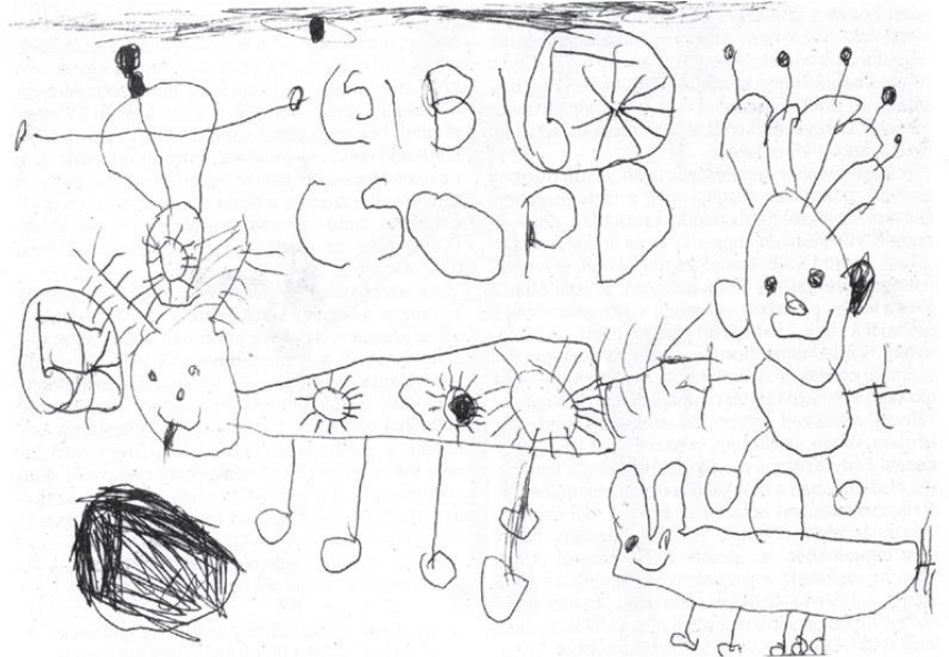
2. kép. Buka Borbála Zsuzsanna (5 éves): Dozmati regősének