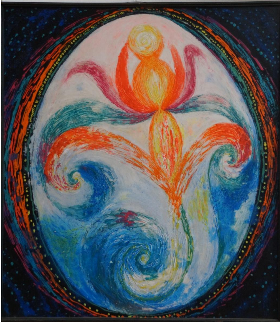
Világtozás (100 x 90 cm) a Terem-tő jelével

ahogy mondják... Eufórikus élmény volt. Festészetre, néprajzra, anekdotákra, jó értelemben vett bölcsekedésre számíthattak talán a jelenlévők, de erre biztosan nem... Végtelenül összetett, szinte félelmes élmény volt, több minden képzelhetőnél, s vázolt is valamit abból, amit csak Ő tudott (és látott is valószínűleg egyben).