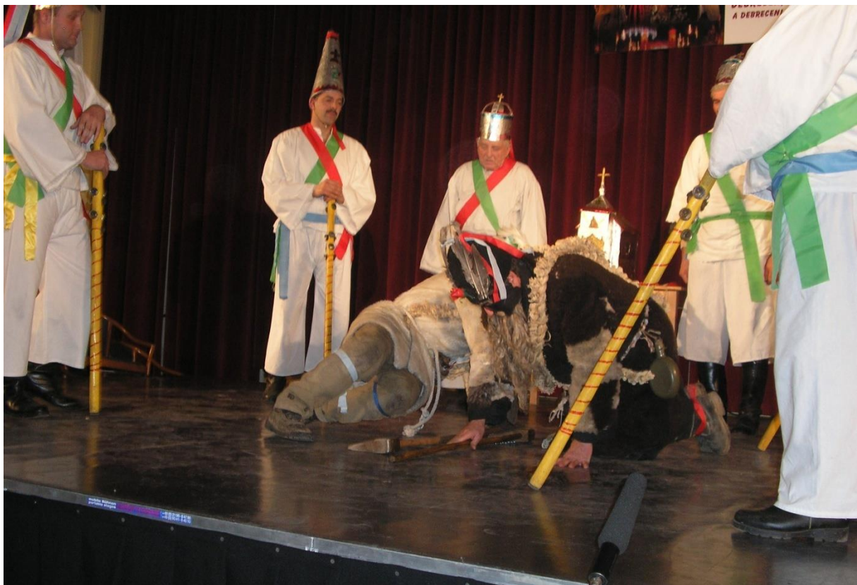
... az Öregek kettőse: fehér-fekete