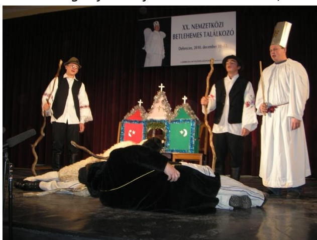
Az Öreges révülése: lefekszenek a betlehem elé (ellentétes: yang-jin pózban)