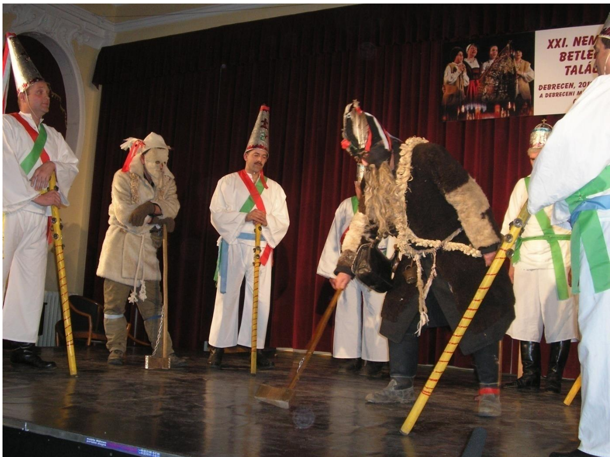
Angyalok és pásztorok egyforma fehérben, a maszkos Öregek mások...