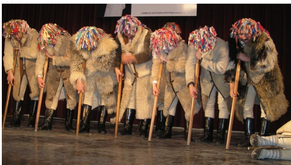
7-en is lehetnek